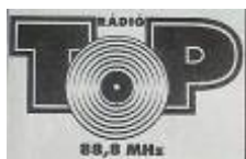
Rádió Top Elősóban