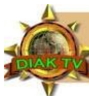
Diák Tv Képújság